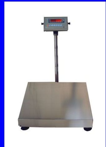
SERIE BX 314