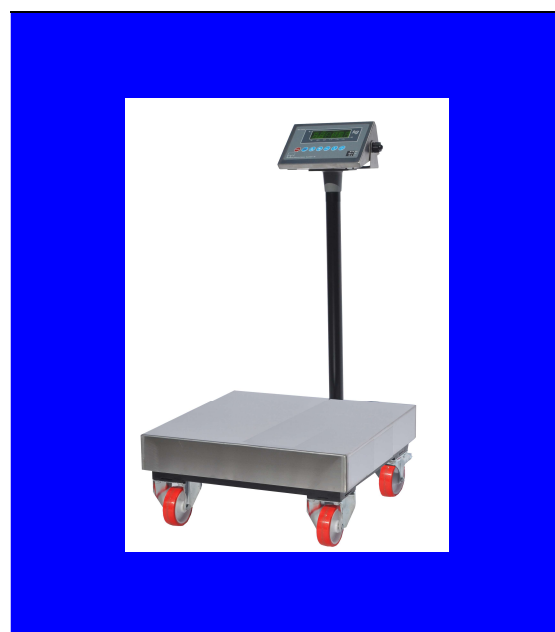
SERIE BX 314