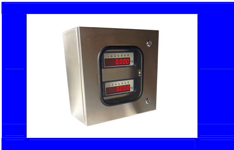
N° 2 D162 ripetitore RS160H1 Montaggio in quadro inox IP68