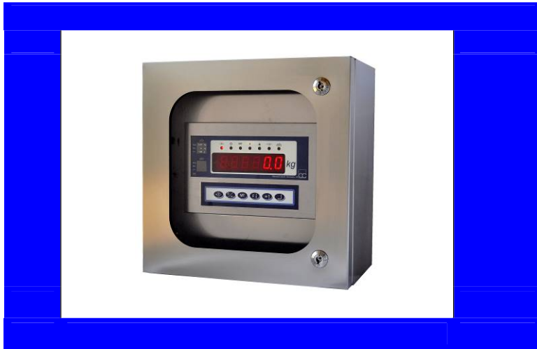
D160 release U672 In quadro inox IP 68