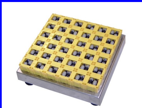
Piattaforma con rulli per spostamento ortogonale del carico Portata dinamica 100 kg