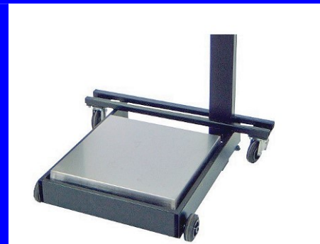
Piattaforma integrata in carrello per picking Portata dinamica 600 kg