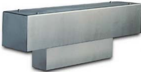
Mod PAA Portata 300 kg Tratto di pesatura da 30 cm

🌐 http://www.bilco.it ✉ E-mail: bilco@bilco.it 🌐 http://www.verificaperiodica.it