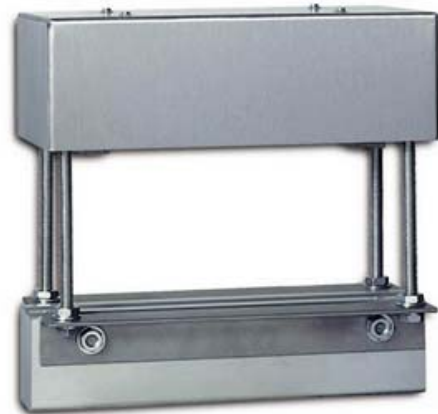
Mod PAT Portata 300 o 600 kg Tratto di pesatura nelle versioni standard di 30 in alternativa 60 cm