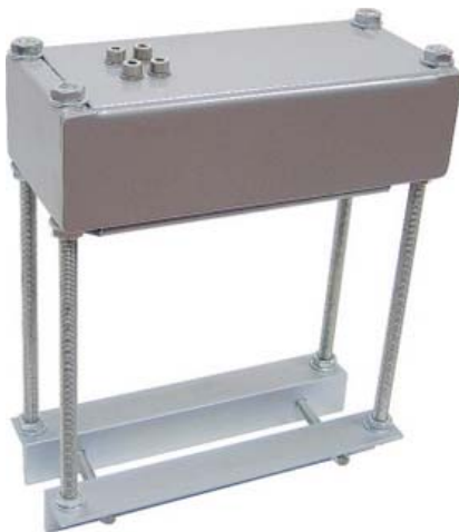
Mod PA-TZE Portata 300 kg Tratto di pesatura da 30 cm