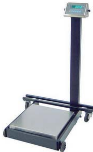
Mod AS18A con visore XK315 a batteria con opzione carrello