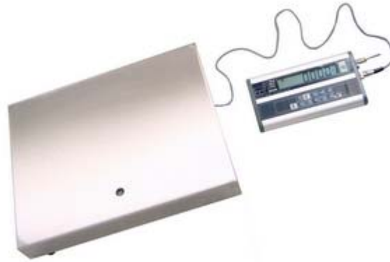
Mod AS18S con visore S180

C.C.I.A.A Milano 588390 • Registro imprese 50855/96 • Meccanografico MI253340 • P.IVA00408140150 • C.F. CLMGPP47D15F2050 Via Lazio, 87 20090 Buccinasco (Milano) ☎ +39 0245713365 📠 +39 0245713381 🌐 http://www.bilco.it ✉ E-mail: bilco@bilco.it 🌐 http://www.verificaperiodica.it