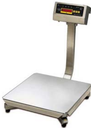
Mod AS18B con visore S120